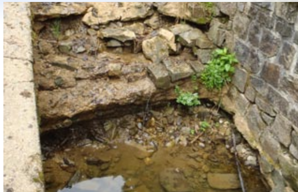
Obr. 1 – Poškozené dno skluzu bezpečnostního přelivu je třeba urychleně opravit.

Při prohlídkách mají být předloženy záznamy z vykonávaných obchůzek a pořízen zápis z prohlídky podle obsahu uvedeného na následujících stránkách. Zápis obdrží každý z účastníků a je uložen také na vodoprávním úřadě.