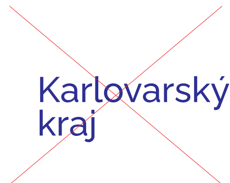
logotyp | zakázaná varianta použití